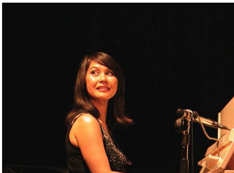
Concert à la Coupole de La Gaude 2007