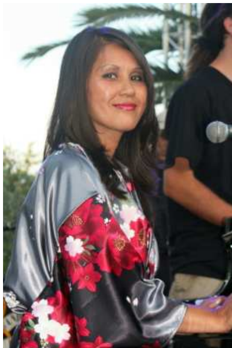
Concert inaugural Estivales 2009 Conseil Général Musée des Arts Asiatiques, Nice