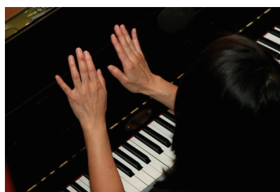
Au So'What Jazz Club, La Gaude 2010

Une telle invitation au voyage ne se refuse pas !