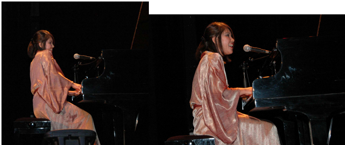
Théâtre Michel Daner, Beausoleil 2007