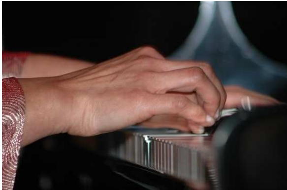
La Gaude Jazz Festival 2007

( Musicologue, journaliste, responsable du Centre d'Information du Jazz )